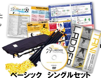
ベーシック シングルセット