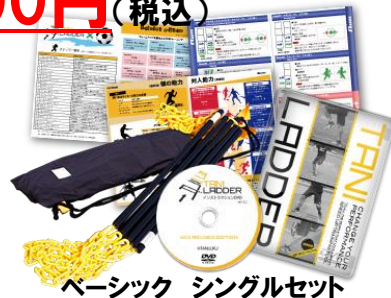
ベーシック シングルセット